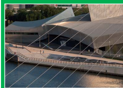
Design FoRM Associates Engineering Gifford Location Manchester, UK Client Peel Media

Quayside designed by London-based FoRM Associates in front of Imperial War Museum North by Daniel Libeskind is now open to the public. The new quayside completes the first section of the Inwell River Park master plan, 8km long river edge park linking Salford, Manchester and Trafford developed by FoRM Associates in 2010. With the adjoining new Media City foot bridge by Wilkinson Eyre Architects the quayside delivers an important new strategic circulation loop in the Quays, a key regeneration zone in Greater Manchester. The